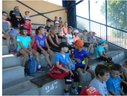
On écoute les consignes de rentrée