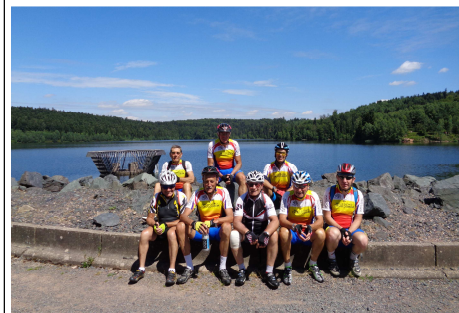
Une petite pause devant le lac de Pierre Percée