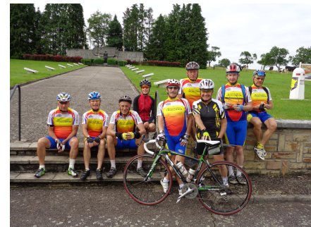
En route pour l'ancienne ville forte de Fontenoy-le-Château