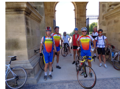
On joue les châtelains à Lunéville

Les membres du club ont participé également à de nombreuses autres sorties notamment du 10 au 17 avril le Séjour de printemps à La Londe-les-Maures dans le Var, le 22 mai la randonnée Jeanne d'Arc à Neufchâteau, du 4 au 5 juin la Cyclomontagnarde du Jura à Lons-le-Saunier, du 25 au 26 juin la cyclomontagnarde des Vosges à Eguisheim, le 4 septembre la randonnée des Images à Epinal...nos maillots estampillés MIRECOURT suscitant un grand intérêt pour notre ville.