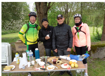
Une équipe efficace