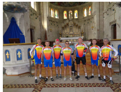
De drôles de paroissiens dans la Basilique du Bois Chenu