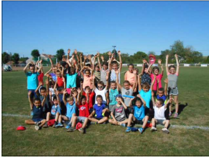
La reprise de l'école d'athlé