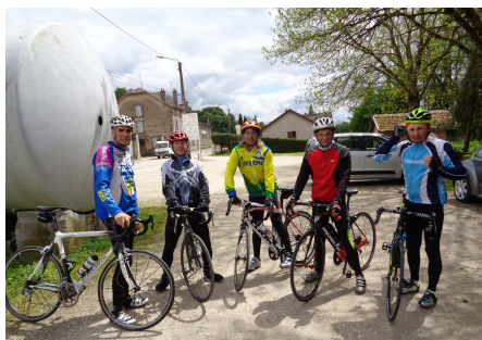
Les vittellois du club en force